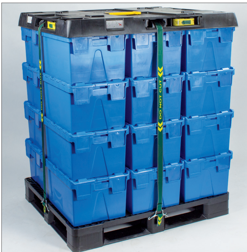
Couvercle Clever léger pour palettes en bois et en plastique.