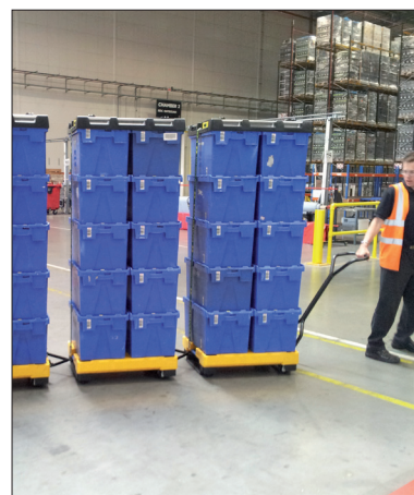
En option : barre de traction et raccords amovibles.

Le couvercle est muni de sangles entièrement intégré avec mécanisme à cliquet. Le Clever lid est disponible avec 2 ou 4 sangles. Les sangles sont remplaçables ou échangeables sous forme de cassette.