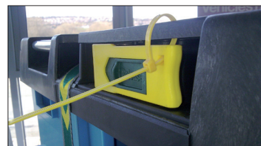
Possibilité de cachetage.