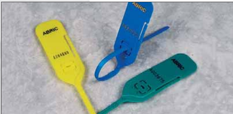
Fermetures Smoothlock™ : sont lisses et flexibles pour faciliter la fermeture. Mécanisme de fermeture en acier, extrêmement fiable!

Sûreté absolue par le mécanisme de fermeture en acier. Facile à attacher, grâce à la bande lisse, la fermeture est rapide.