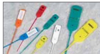
Cachetage Jawlock et Mini Jawlock.