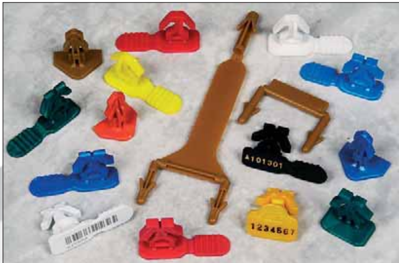
Cachetages Arrowlock™ pour les bacs de distribution.

Cacheter? Pas seulement pour les risques de vol, mais aussi pour des raisons de responsabilité sur les produits, et contre le terrorisme. Le cachetage est une solution, contre tous les trafics.