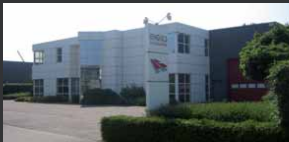
Engels Zonhoven, Belgique.

Tél.: +32-11 81 50 50 Fax: +32-11 81 50 60 E-mail: post@engels.eu