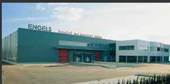
Engels Eindhoven, les Pays-Bas.

Tél.: +31-40 26 29 222 Fax: +31-40 26 29 200 E-mail: contact@engels.eu