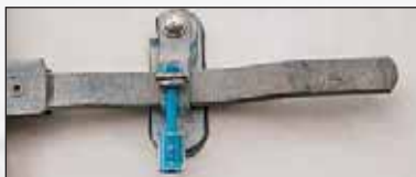
Unolock™, résistance une tonne !

Le cachet de fermeture le plus sûr de notre gamme est le Unolock™. Certifiée par la douane du Royaume-Uni, en version imprimé ou neutre. Pour une sûreté maximale les numéros du crochet et du chemisage correspondent. Le chemisage et le crochet ont une finition en plastique (SAN), pour que les tentatives de fraude laissent des traces.