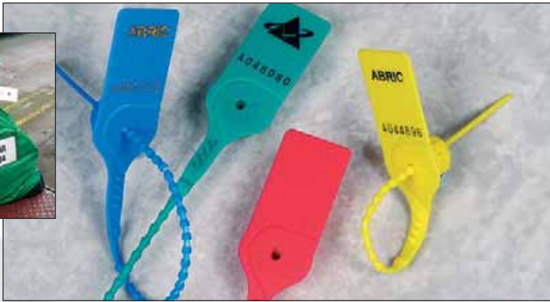
Fermetures Packlock™, à sécurité élevée par un mécanisme en acétal. Aussi avec étiquette extra large.

Packlock™, grâce à un mécanisme inaccessible il n'est pas possible de le refermer après ouverture. Simple à enlever par le 'twist tear off' ligne. Couleurs rouge, bleu, blanc, vert et jaune. Livraison par feuille de 5 pièces, 1000 colliers par carton. Diamètre 3,7 mm. Etiquette standard 60x28 mm, étiquette extra grand 110x73 mm.