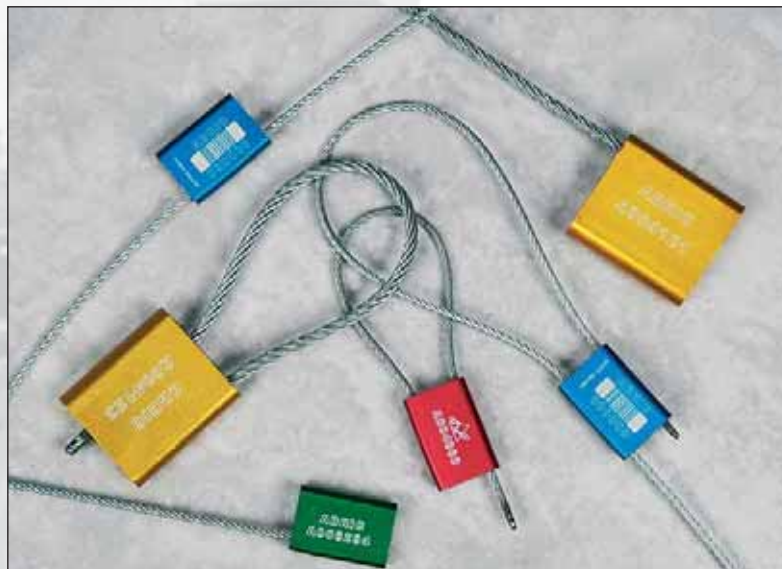
Cachets/cadenas en aluminium/acier Alulock™.

Pour une ouverture uniquement possible par pince coupante, opter pour Alulock™ ou Unolock™. Résistance de - 40 ° à +120 ° C. Avec l'Alulock™, le câble est sous tension, après rupture, les fils se désolidarisent et il est, alors, impossible de refermer le cachetage. Les gaines Alulock™ sont disponibles en noir, blanc, bleu, vert, rouge ou doré, également possible avec code barres.