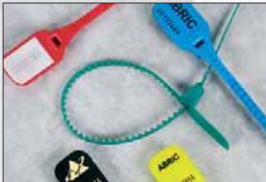
Baglock™, fermeture simple et à collier pour sacs.

Baglock™, les scellés à bague sont solides et plus simples. Dentés sur un côté. Coloris comme Riblock™. Livraison par feuille de 5 pièces, 1000 scellés par boîte.