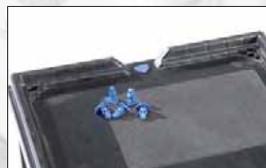
Bac RAKO avec couvercle "Antivol", 2 cachetages à pression.