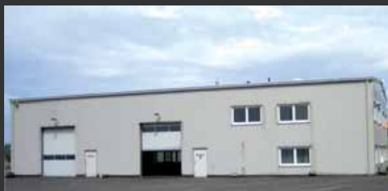
Engels Selmsdorf, L'Allemagne.

Tel.: +49-38823 53804 Fax: +49-38823 53806 E-mail: contact@engels.eu