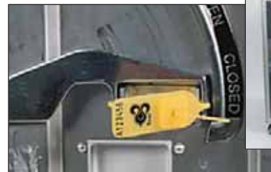
Trolley de restauration avec cachetage Jawlock™.

Dans l'aviation la sécurité est une priorité. Les contrebandiers et les terroristes testent les méthodes de sécurité continuellement. Pour cette environnements exigeant nous proposons les cachetages Jawlock™.