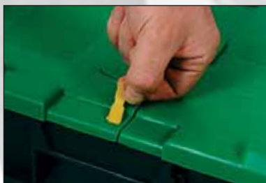
Avantage: facile à enlever par demi tour.

Nous fournissons des cachetages compatibles avec chaque marque des bacs de distribution connue, aussi bien les bacs pliables que les emboîtables.