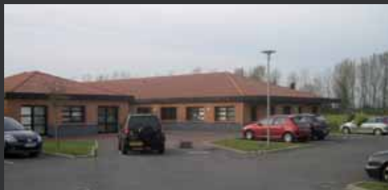
Engels Hem, France.

Tél.: +33-3 20 73 87 40 Fax: +33-3 20 99 06 44 E-mail: contact@engels.eu