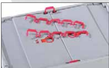
Bac pliable avec deux cachetages en U.