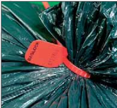
Fermer et cacheter en une fois avec Riblock, Baglock ou Smoothlock.

Sécurité élevée : pourvu d'un mécanisme de fermeture inac- cessible. Types : Jawlock et Smoothlock avec mécanisme en acier, Securelock avec mécanisme en acétal. Stable entre -20° et +80° Celcius.