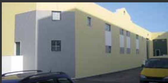
Engels Prior Velho, Portugal.

Tél.: +351-21 94 13 320 Fax: +351-21 94 13 319 E-mail: contact@engels.eu