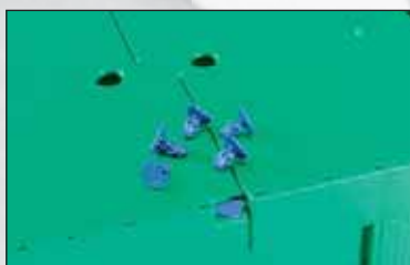
Bac pliable avec 2 cachetages à pression.