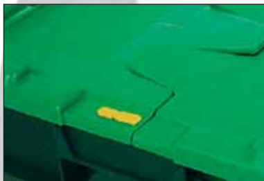
Détail d'un cachetage (AL04).