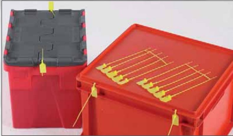
Scellés Lightlock™, sont adaptés pour les bacs de transport et les extinc- teurs, par exemple.

Lightlock™ est notre cachetage de base, destiné à des applica- tions sans risque, tels que le transport terrestre. Disponible en rouge, orange, jaune, bleu et vert. Étiquette 35x21 mm, diamètre 2,6 mm. Livraison en tapis de 5 pièces, 1000 unités (longueur 170 mm) ou 2000 unités (longueur 220 mm) par boîte.