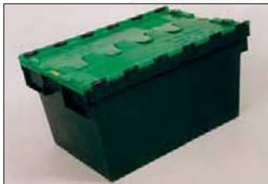
Bac de distribution avec un couvercle dit « crocodile ».