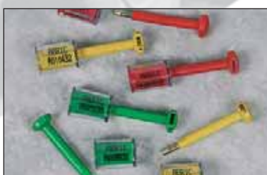
Unolock™, s'ouvre seulement à la pince monseigneur.