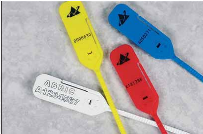
Scellés Riblock™ dentés bilatéralement.

Riblock™ résistant aux tentatives d'ouverture par effraction grâce aux dents bilatérales. Forme des dents, ergonomique à fixer et le 'side tear off' ligne permet un enlèvement facile. Couleurs rouge, bleu, blanc, vert et jaune. Livraison par feuille de 5 pièces, 1000 cachets par carton. Largeur 5,5 mm, épaisseur 2,2 mm.