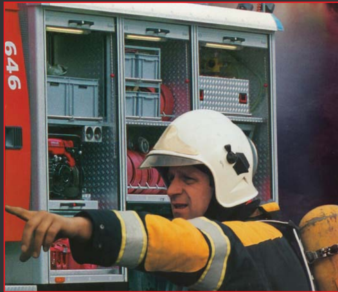
Stockage du matériel dans les véhicules