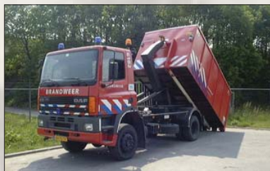
Pour chaque sinistre, le camion peut atteler la remorque appropriée.

La société Engels a obtenu le marché pour la fourniture de ces bacs. Par conséquent le bac Rako est devenu la norme pour les pompiers néerlandais. En 2006, nous avons remporté l'appel d'offres du SDIS 69 pour les contenants plastique, et depuis nous sommes fournisseurs de nombreux SDIS en France.