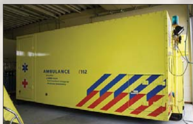
Les pompiers, mais aussi des hôpitaux régionaux ont leur propre conteneur d'intervention (ici de l'UMG (NL))