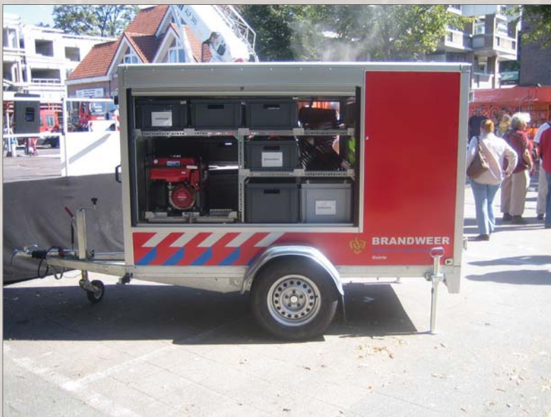
Dans les remorques, des espaces sont prévus pour les bacs Engels.

Avant on devait adapter les bacs à la taille des véhicules. Actuellement, les véhicules sont prévus pour accueillir les caisses norme europe, ainsi la mise à mesure des bacs n'est plus nécessaire. Toutefois nous proposons toujours à la demande du client, des poignées ra battantes des portes étiquettes ou des différents types de marquage.