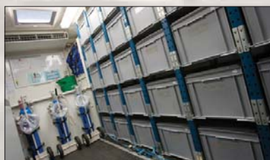
Des bacs de pansements dans une nacelle médicale