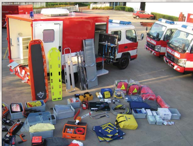
Contenu d'un conteneur de secours pour transports aériens

Grâce aux équipements standardisés, le personnel de chaque corps peut trouver facilement le matériel dans les conteneurs d'un autre corps. Pendant les interventions, le stress est inévitable, le gain de temps en recherche de matériel est indispensable, ainsi les équipes sont plus concentrées sur leur mission.