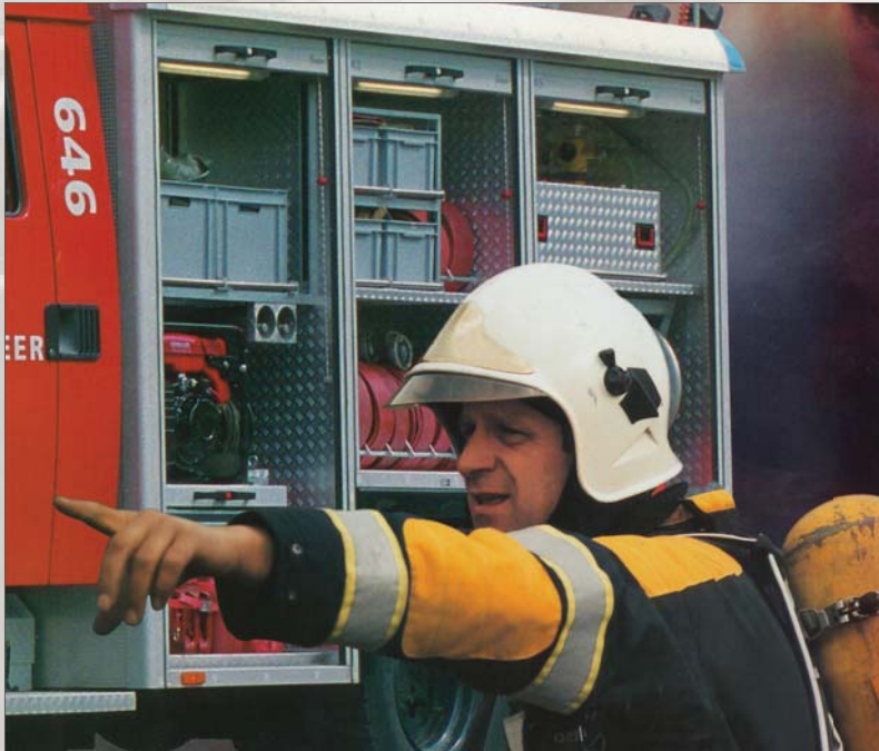
Chaque véhicule d'incendie est équipé de bacs plastique Engels

Avant on devait adapter les bacs à la taille des véhicules. Actuellement, les véhicules sont prévus pour accueillir les caisses norme europe, ainsi la mise à mesure des bacs n'est plus nécessaire. Toutefois nous proposons toujours à la demande du client, des poignées ra battantes des portes étiquettes ou des différents types de marquage.