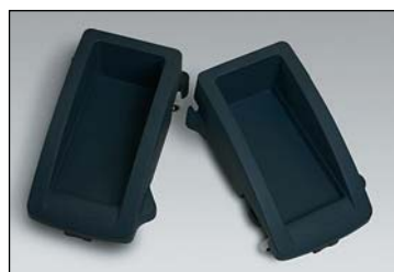
chariots amovibles, s'adaptent aux deux hauteurs

nos poubelles tours ("Grand Jean"), tout en hauteur, occupent peu d'espace au sol. Elles sont faciles à nettoyer et s'intègrent parfaitement dans les locaux de travail et les espaces publics.