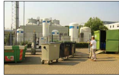
centre de dépôt des déchets hospitalier à l'université de Maastricht

Nous proposons aussi un système d'attelage. Un chariot élévateur peut déplacer plusieurs conteneurs ensemble vers le point de collecte