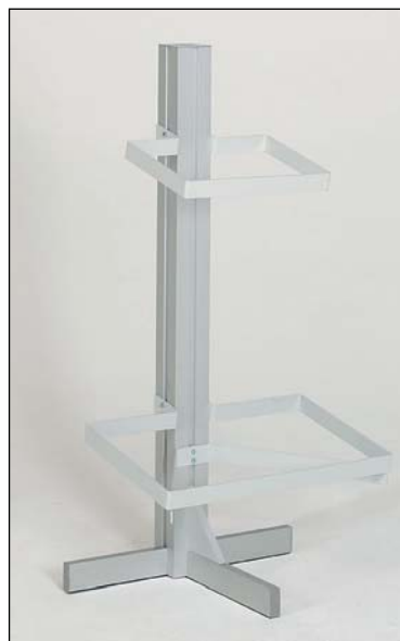
écolonne sans bacs