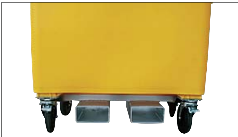
fourreaux de manutention pour un transport et un vidage simple

Pour garder les mains propres, et ainsi éviter la propagation des infections et aussi pour ménager le dos !