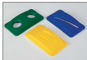
trois couvercles, conçus spécialement pour les différents flux

Nous en avons en stock à 3 niveaux, convenant pour 3 à 6 fractions. Leur conception modulaire permet de réaliser facilement d'autres ensembles: nous proposons également des écolects à 2 ou 4 niveaux, parfois même avec portes.