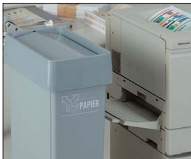
corbeille "Grand Jean" haute à couvercle oscillant

Les écolects sont des armoires haute gamme sur roulettes se composant de cornières en aluminium et de panneaux synthétiques mélaminés.