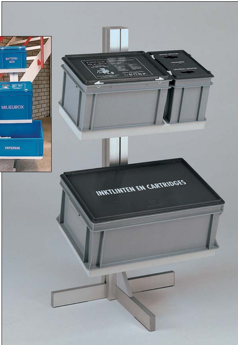
colonne fournie à la TU Delft