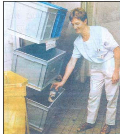
écolonne au sein de l'hôpital Katherina à Eindhoven (coupe du journal ED 2003)