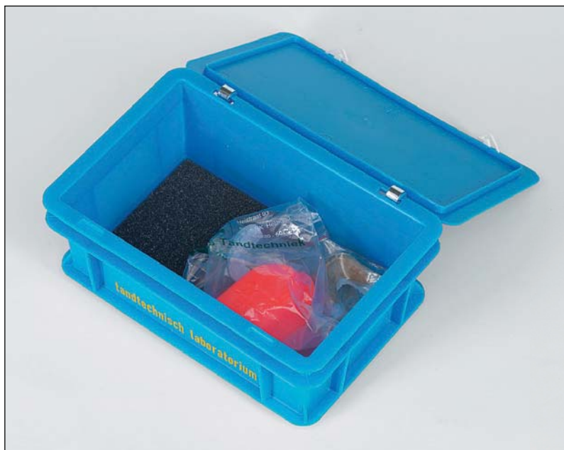
boîtes d'expédition réutilisable, en couleur grise, rouge ou bleu, l'étiquette et le porte-étiquette autocollante sont inclus (n° d'art. LH18804)

Dans les laboratoires dentaires, nos bacs RAKO sont utilisés pour le transport des produits depuis des années, pour l'envoi postal. Ils sont produits en polypropylène quasi incassable. Les charnières peuvent éventuellement être pourvues des renforts en acier inox.