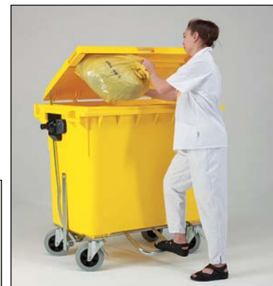
pédale d'ouverture, barre de traction et roues lisses.