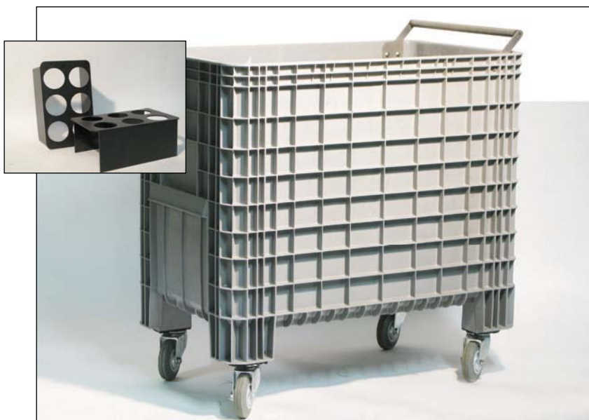
un bac grand volume, avec des roues non traçantes et un système d'attelage, pourvu des intérieurs fait sur mesure

Notre chariot peut stocker 18 bouteilles de 3 dimensions différentes. Chaque chariot peut stocker 18 bouteilles en 3 dimensions différentes.