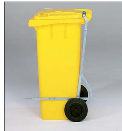
pédale d'ouverture pour conteneurs de 140/240 l. Amovible