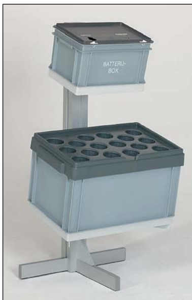
il est possible de combiner tous les bacs de collecte